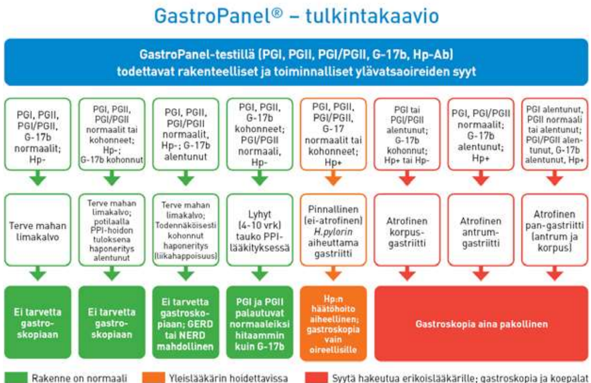
Kuva 4. GastroPanel-testin biomerkkiaineprofiilit

Sitä mukaa kun tietämys kroonisen gastriitin luonnollisesta kulusta (8,11) ja dyspepsian syiden taustoista lisääntyi, selkiintyi myös kajoaviin (invasiivisiin) tutkimuksiin liittyvien edellä lueteltujen ongelmien tiedostaminen globaalisti. Vaihtoehtoisina testeinä alettiin tutkia yksittäisiä verikokeesta määritettäviä maha-